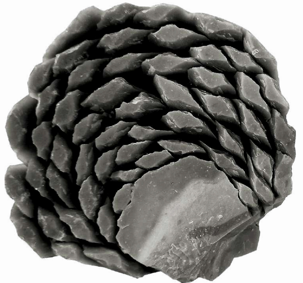
Składanka rdzenia (replika) kultury Ertebølle