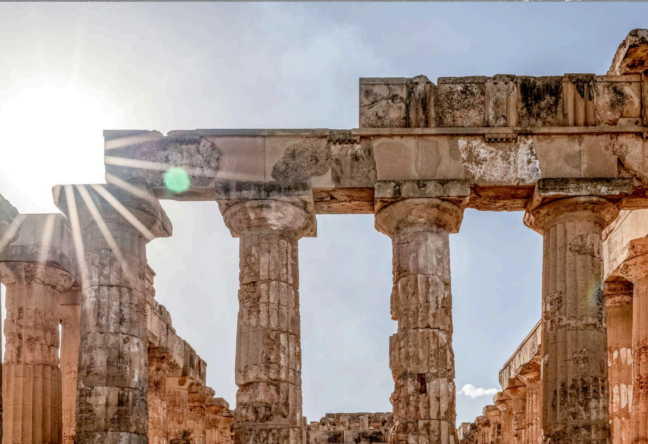
Selinunte, Sycylia Świątynia Hery (Tempio di Hera) w antycznym Selinous, 460 p.n.e.