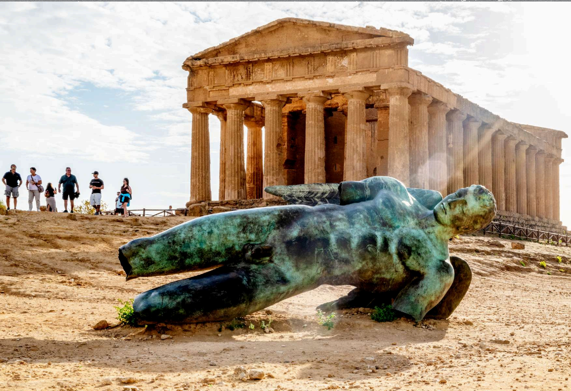
Argigento Valle dei Templi, Sycylia Świątynia Concordii/Zgody (Tempio della Concordia) w antycznym Akragas, 440–430 p.n.e.; na pierwszym planie rzeźba Igora Mitoraja „Icaro caduto” (Upadek Icara)