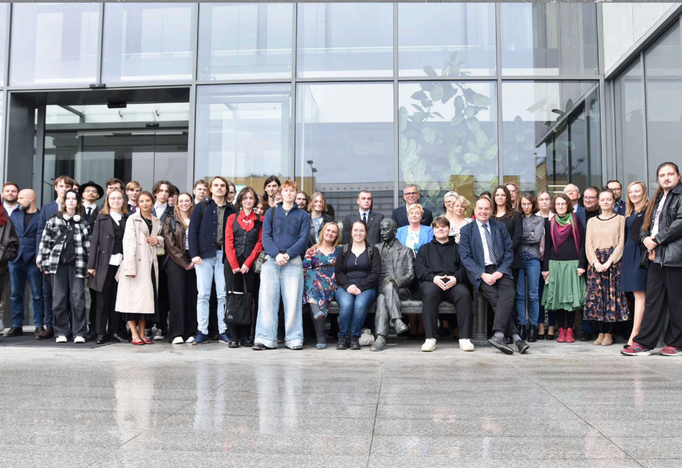
Studenci I roku kierunku archeologia wraz z pracownikami Wydziału Archeologii UAM rok akademicki 2024/2025