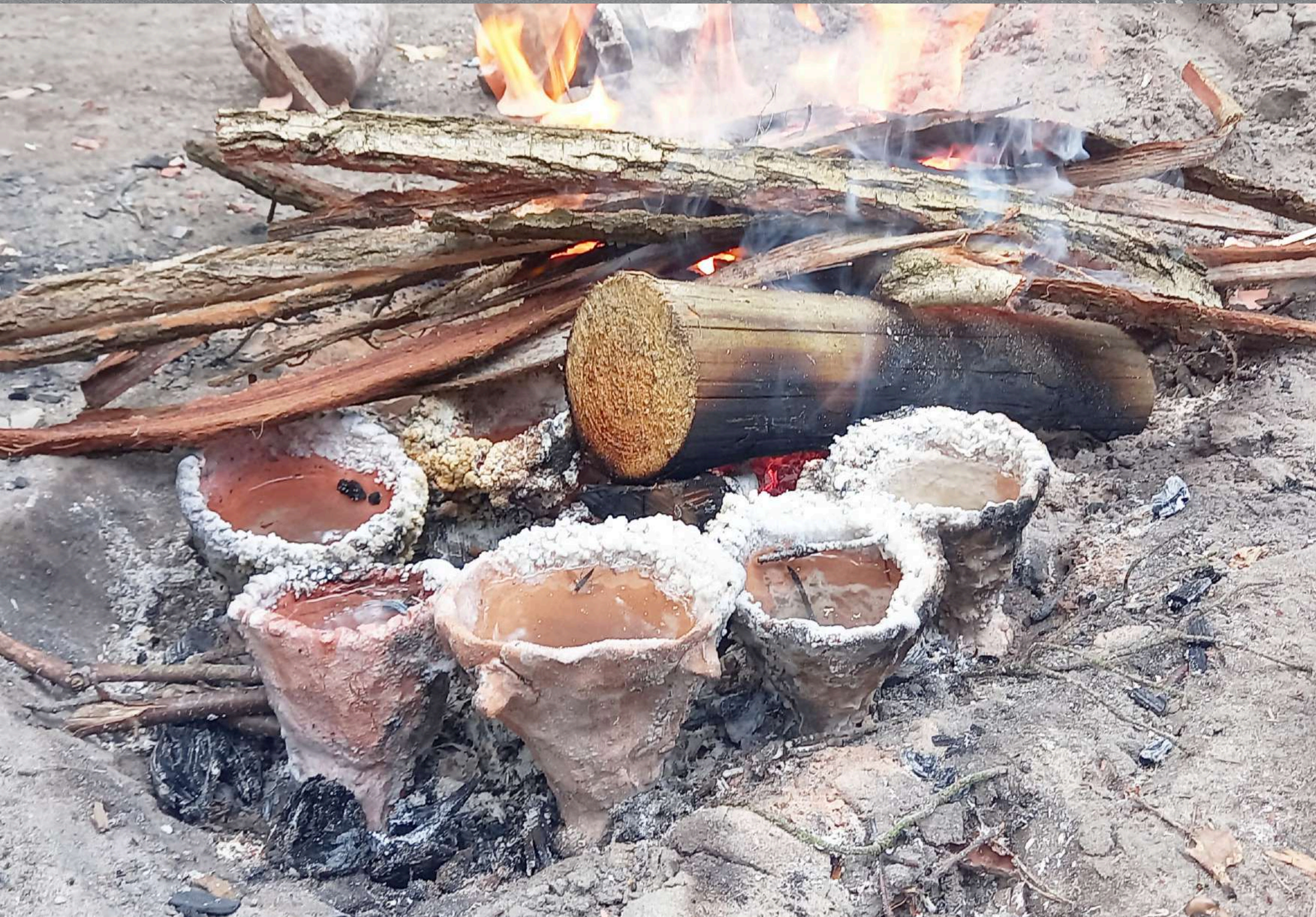
Eksperymentalna produkcja soli XII Krzemionkowskie Spotkania z Epoką Kamienia