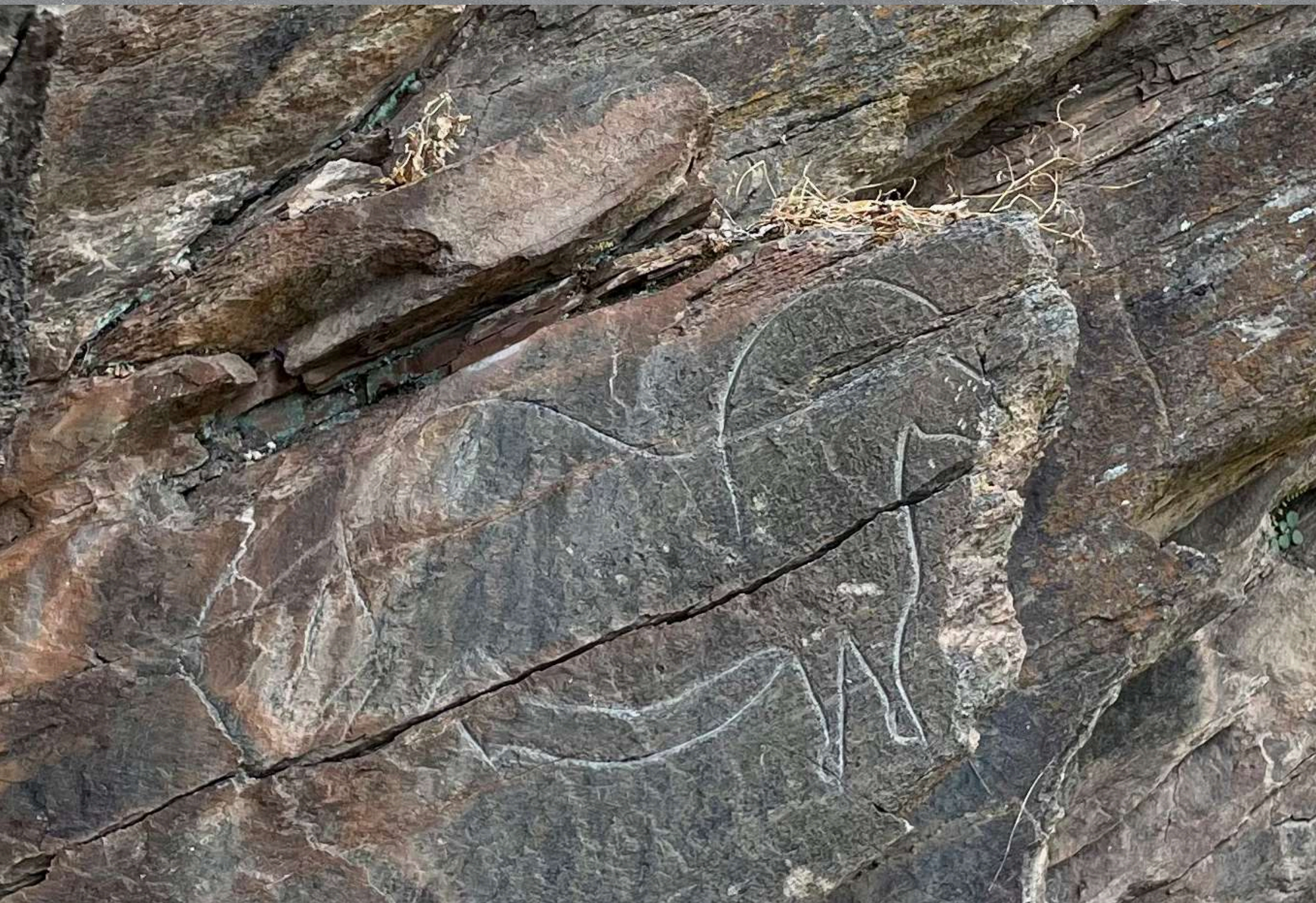
Mazouco, Portugalia górnopaleolityczna sztuka naskala, przedstawienie konia